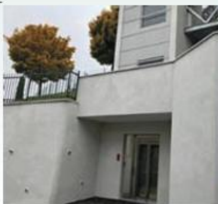
Rue du Terrat

Ce parking situé route « Côte Gauthier » dispose de 26 places de stationnement. Il est utilisé par les riverains et les parents qui déposent leurs enfants aux écoles. Cela évite le stationnement gênant le long des routes « Chemin de l'Oiseau » et route « Côte Gauthier ».